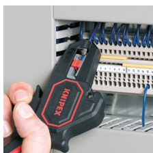
Avisolering i trånga utrymmen