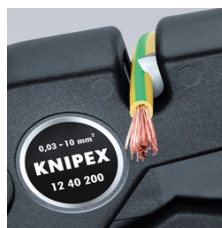
Trådavbitare till 10 mm 2 flertrådig