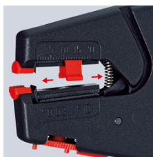
12 40 200: Inställningsbart längdstopp