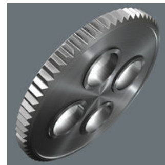
Fintandad mekanism med 60 tänder ger en så kort returvinkel som 6° för precis arbete.