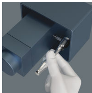
Mini-spärrhandtag för alla svårtillgängliga platser.